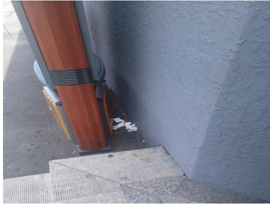
雁栖湖蓝月亮公厕（二类以上）（无运行记录）