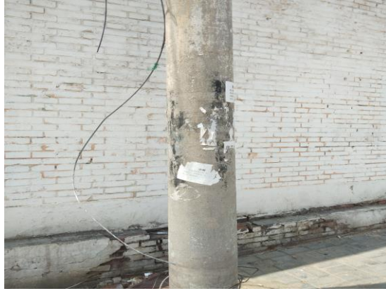
东岳庙街（构筑物表面非法宣传广告清除后不洁）