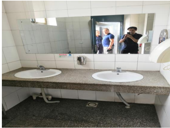
延庆区：920 站公厕（良好） T11:45