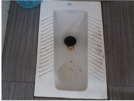
怀柔区：地税北公厕（二类以上）（无厕纸） T11:26