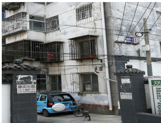
延庆区：恒安北街（良好） T14:01