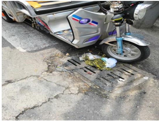
南华园一区 43 号楼南侧路（垃圾收集站周围地面有废弃物） T11:40