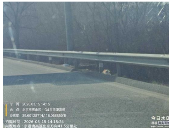
京港澳高速进京方向<琉璃河收费站-六里桥>（房山段：40.6公里处护坡、边沟有废弃物 T14:18//38.4公里处窦店服务区公厕厕位不洁 T14:26）