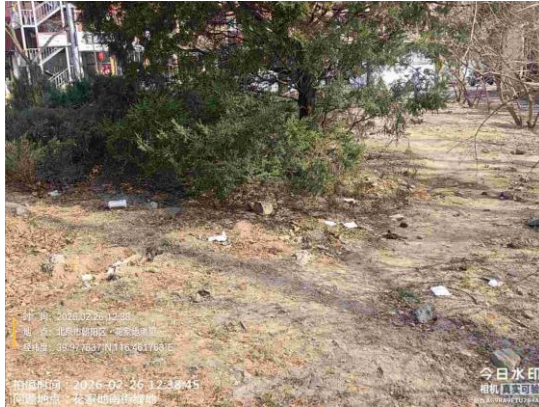
四元桥绿地（朝阳段：绿地内有废弃物 T12:02）