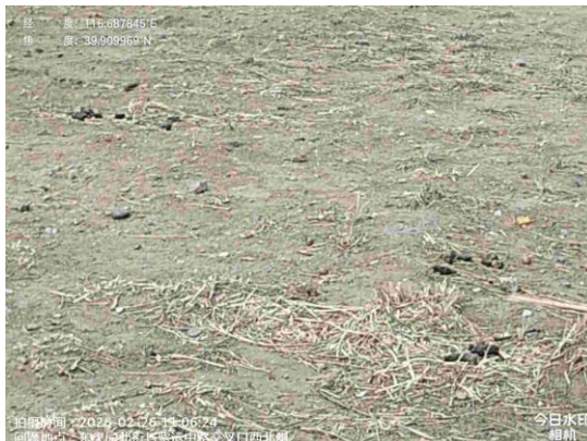
东果园北街绿地（绿地内污物未及时清理 T11:06）