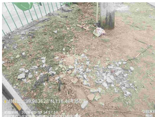
花家地南街绿地（朝阳段：阜通东大街与花家地南街交叉路口向北 130 米处绿地内有废弃物 T14:51）