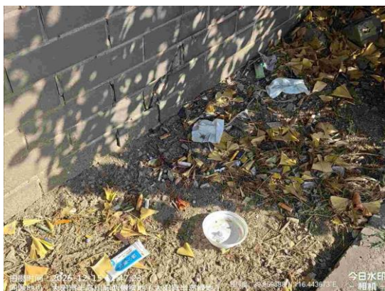
太阳宫北街绿地（绿地内有堆物堆料 T12:11）