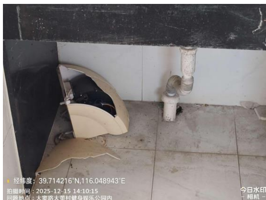
星城公园慧园公厕（排风扇不洁 T11:59）