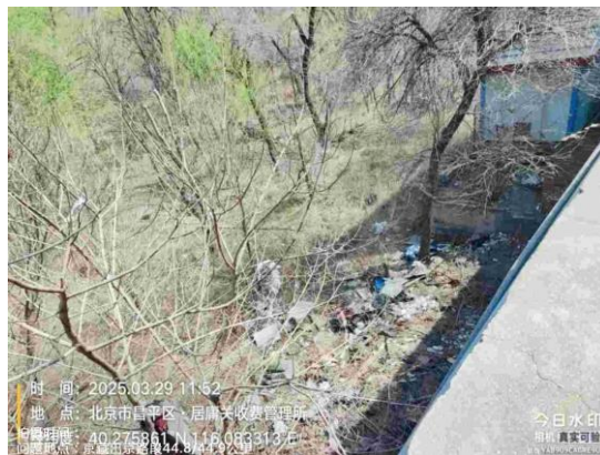
京藏高速进京方向<康庄收费站-马甸桥>(昌平段: 42.2公里处护坡有废弃物 T14:52/26.8公里处服务区沟渠不洁 T15:10)