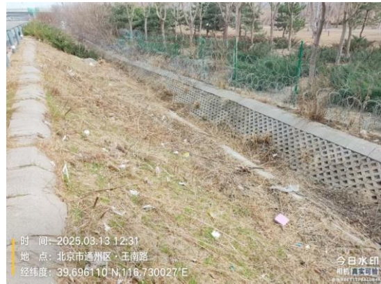
通州段：187.1 公里处服务区护坡有废弃物、路面不洁 T12:51/186.1-186.9 公里处隔离带有废弃物 T12:56)