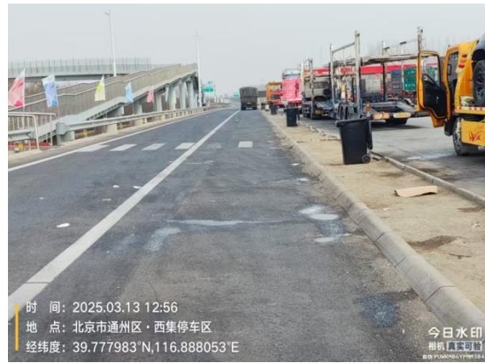
首都环线高速外环方向<采育西收费站-香河西收费站> (通州 段：187.3 公里处服务区责任区内有废弃物、沟渠水体异味严重 T 09:54//187.3 公里处服务区公厕良好/)