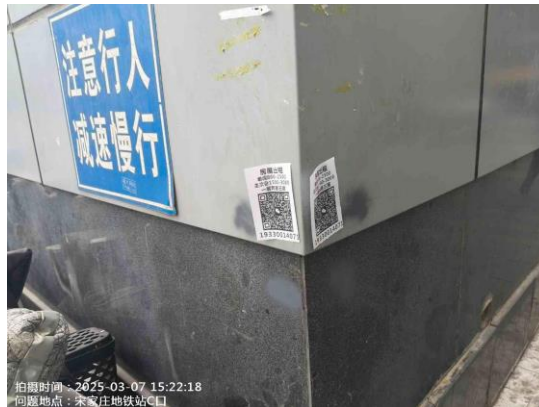
地铁亦庄线(丰台段:宋家庄站 H 口站口责任区内垃圾桶周边不洁 T15:34)