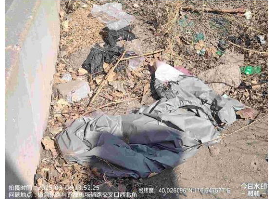
五元桥绿地（朝阳段:五元桥绿地过街天桥东侧绿地内有废弃物 T13:07）