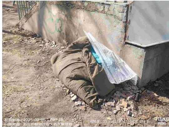
大山子桥绿地（良好）