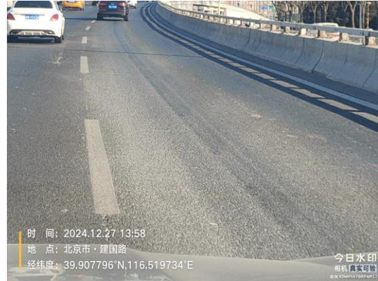
京通快速路东向西方向<八里桥收费站-大望桥> (朝阳段: 13.4公里处道路遗撒未及时清理 T09:51)