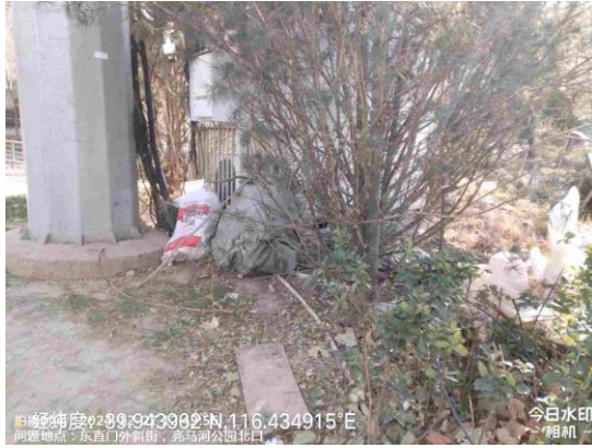
小关绿地（朝阳段：小关绿地西南角左家庄公交车加气站旁绿地内有暴露垃圾 T09:46）