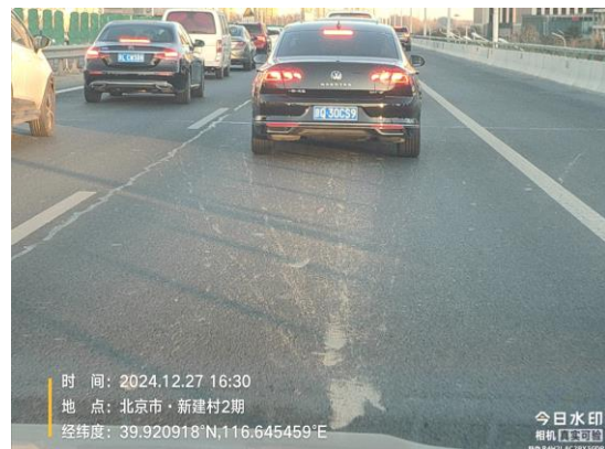
通燕高速进京方向<白庙收费站-通州北关环岛> (良好)