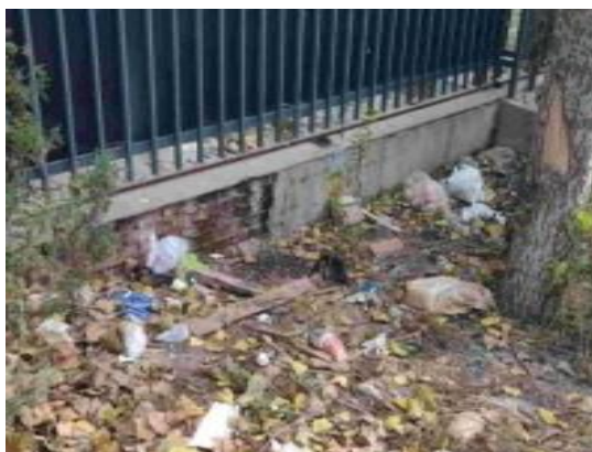
北苑中街与清苑路交汇处西北侧绿地（绿地内有废弃物 T15:15）