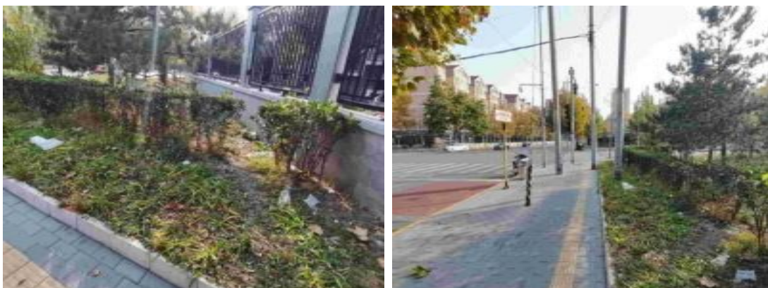
和平路 1 号太利花园绿地（绿地内有废弃物 T14:58）