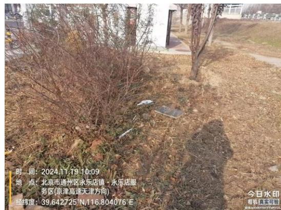
京津高速进京方向<永乐收费站-化工桥>(朝阳段:2.5公里处 道路遗撒未及时清理 T09:36//通州段:33.6公里处中心隔离带有废 弃物 T10:38//33.2公里处永乐店服务区公厕良好//25.8公里处道路