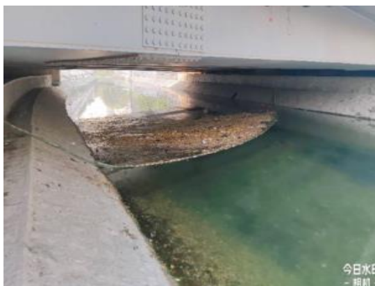
土城沟（水面有漂浮物 T11:25）