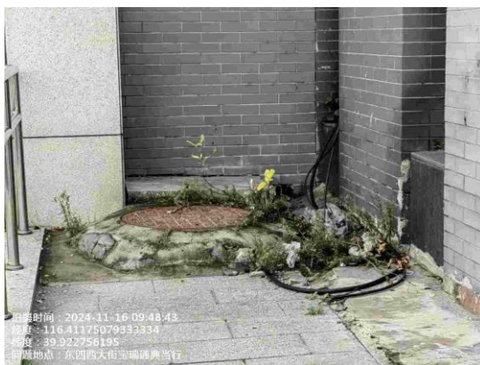
地铁6号线(东城段:东四站G口责任区内有废弃物 T10:07)