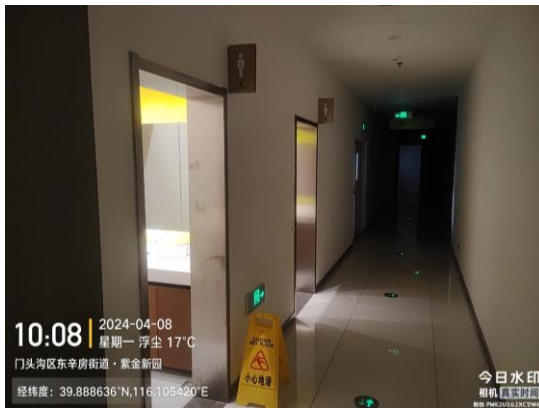
金融街融悦汇商业中心三层班尼路旁公厕(标识牌不符合规范