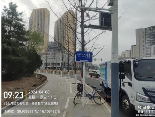
金融街融悦汇商业中心二层回力旁公厕（标识牌不符合规范 T10:04）