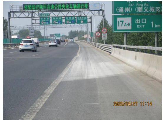
机场第二高速进京方向<T3 航站楼-平房桥> (良好)