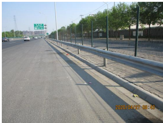
机场第二高速出京方向<平房桥-T3 航站楼> (朝阳段：0.9 公里处路面有浮土杂物 T8:43)