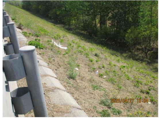
京平高速进京方向<夏各庄收费站-黄港收费站> (顺义段： 40 公里处路面有浮土/ 18.9 公里处路面有浮土 T11:14)