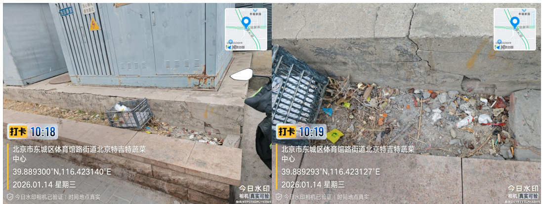
五老胡同(绿化带内有废弃物)T10:34