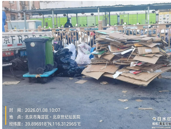
羊坊店南小街马兰拉面门前(地面不洁)T09:52