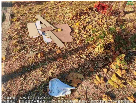
东区市政绿地(绿地内有废弃物)T15:10