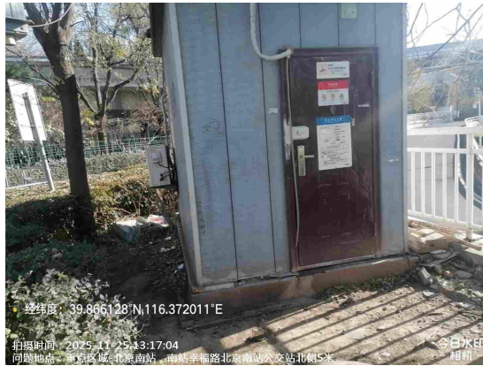
北京南站(绿地内有废弃物)T12:00