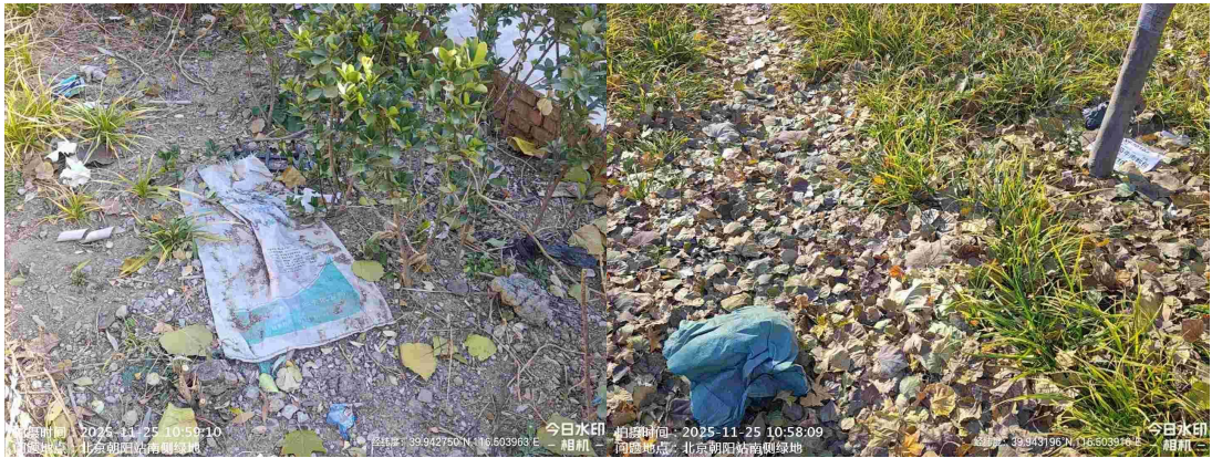
北京西站北广场(良好)T10:59