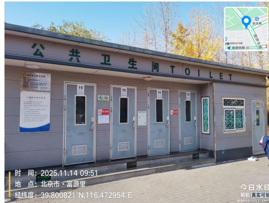
西环中路公厕(大便器内有积存物)T10:00