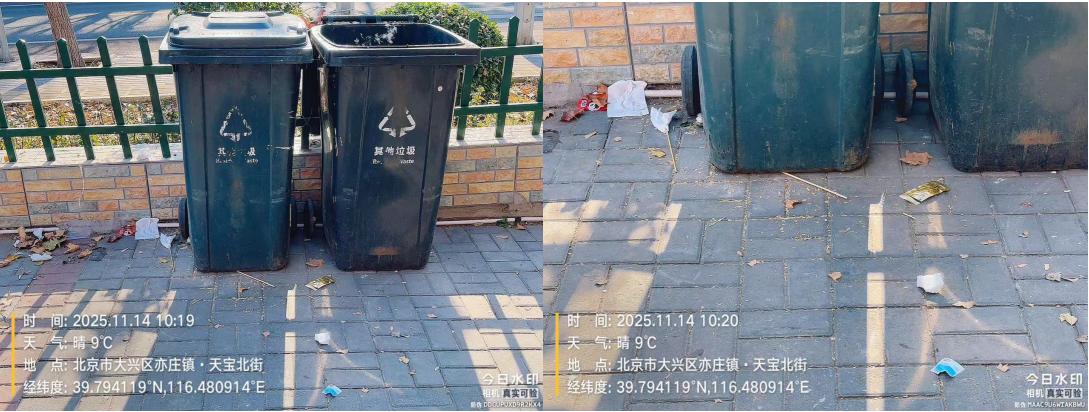
天宝北街中国广电营业厅北侧垃圾收集站点(地面有污渍)T10:27