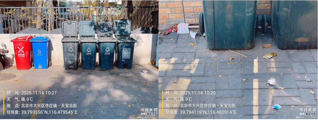
天宝北街(北侧境界家园停车场)(责任区内有废弃物)T10:24