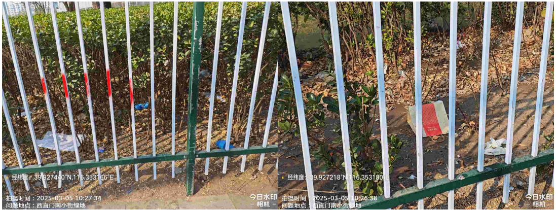
赵登禹路绿地(赵登禹路与西西北六条交叉路口向西 10 米 绿地内有废弃物)T10:08