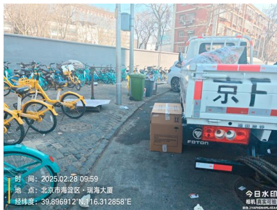
北京西站瑞海大厦北侧路(天猫养车旁路面有浮土)T10:01