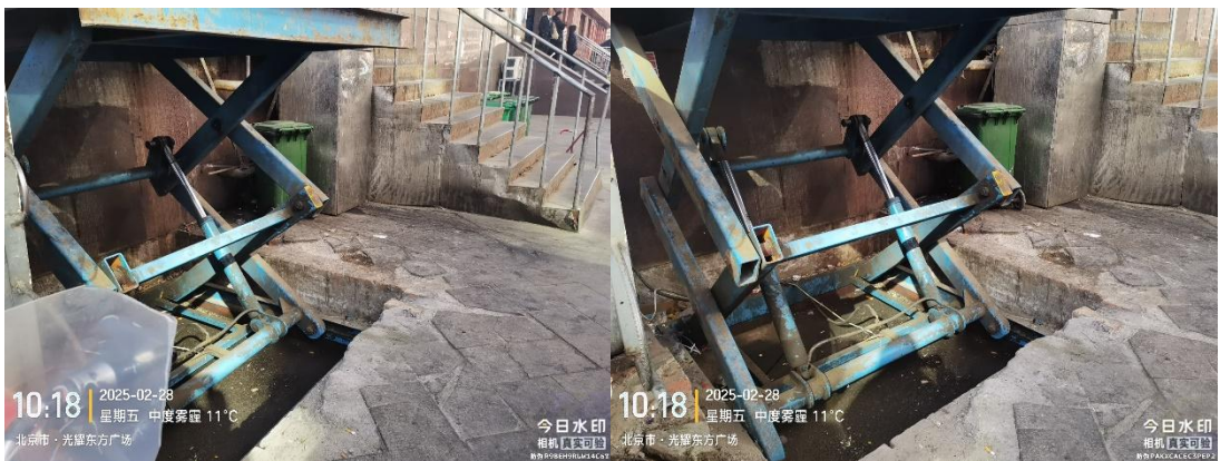
北京西站北广场(图文快印广告公司门前地面不洁)T10:18