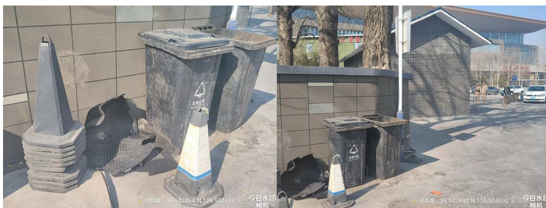
北京朝阳站东侧停车场(东南角有废弃物)T10:20