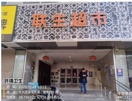
联生超市(责任区内有废弃物)T10:12