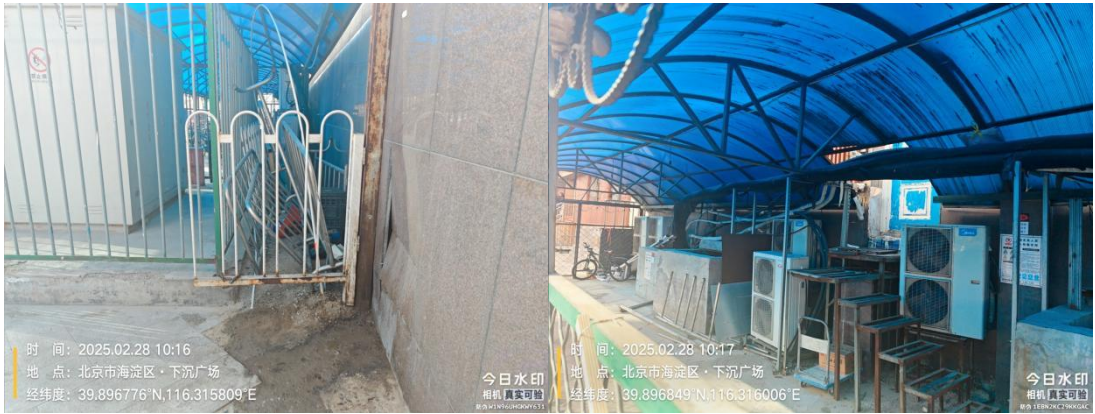
北京西站北广场下沉广场绿地(周边地面不洁)T10:12