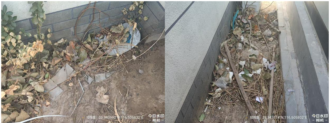
北京西站南广场(休息区地下通道入口周边死角处路面有废弃物)T10:44