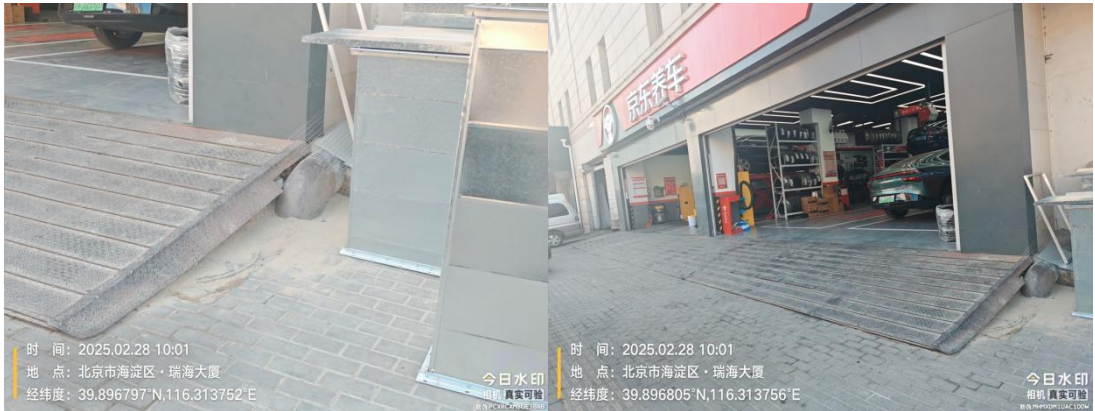
北京西站 P5 地下停车通道(果皮箱周边地面有油污)T10:24