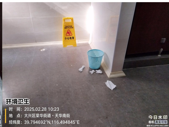
博大公园南侧公厕(良好)T10:30