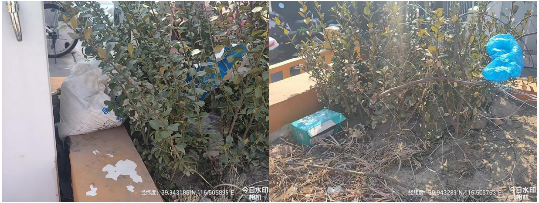
北京朝阳站东广场(东北角变电箱后有废弃物)T10:42