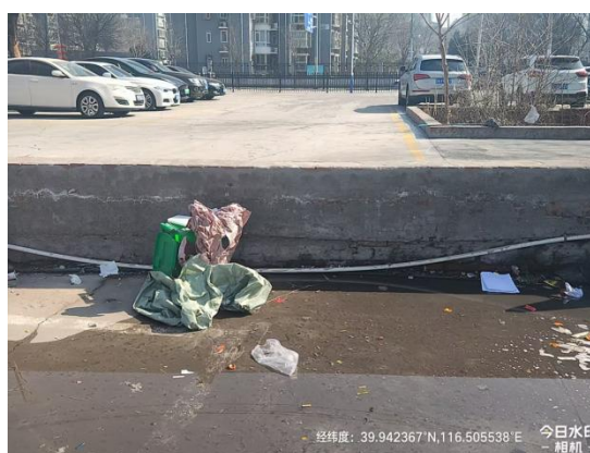
北京朝阳站东广场(南侧绿地有废弃物)T10:26