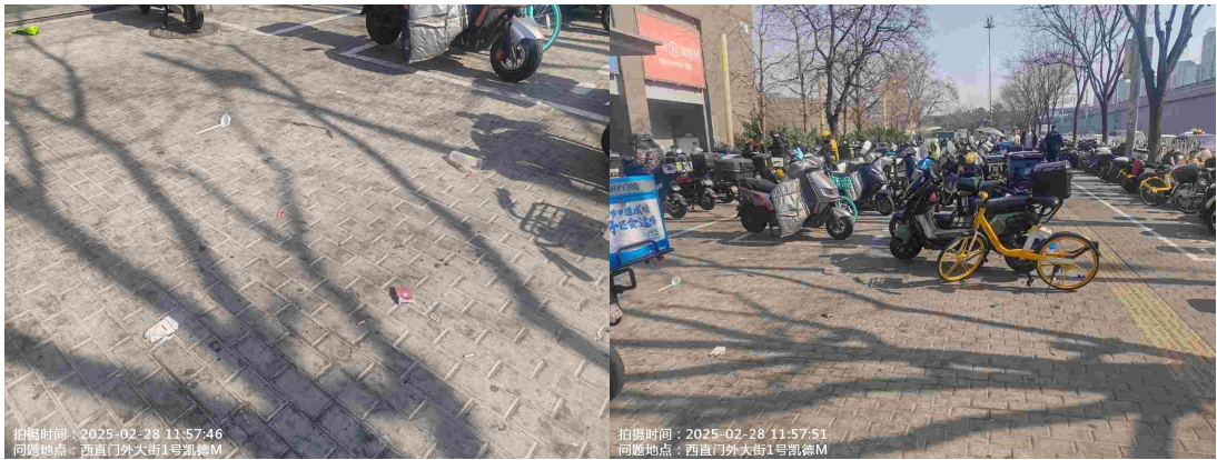
北京西站木楼西小街(北侧路面有废弃物)T09:59