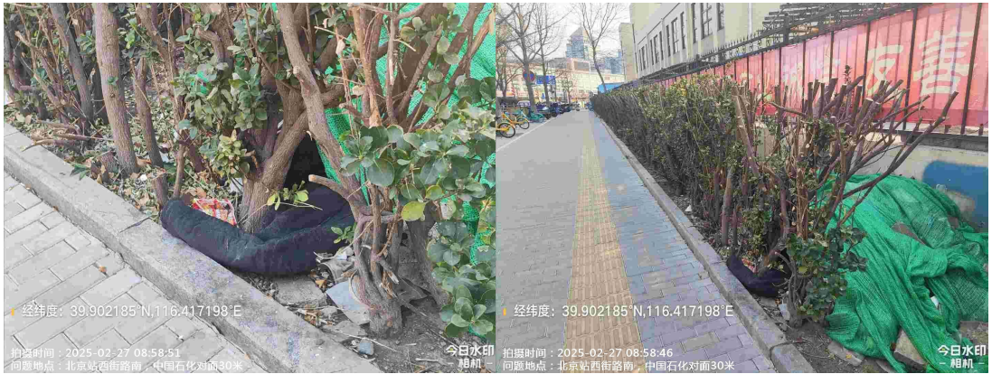
北京站西街路南(天赐顺兴宾馆对面 30 米绿地内有废弃 物) T08: 53