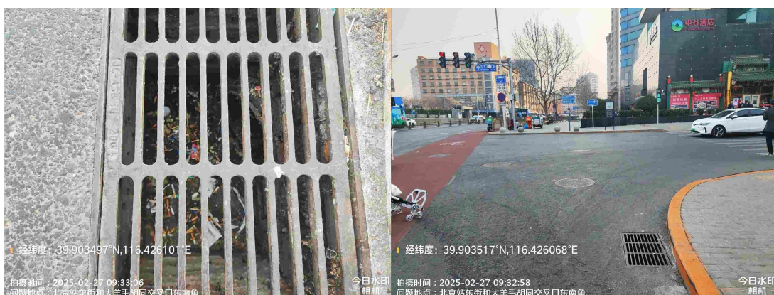
北京站东街(北京站南城香门前 30 米路面有废弃物)T09:17