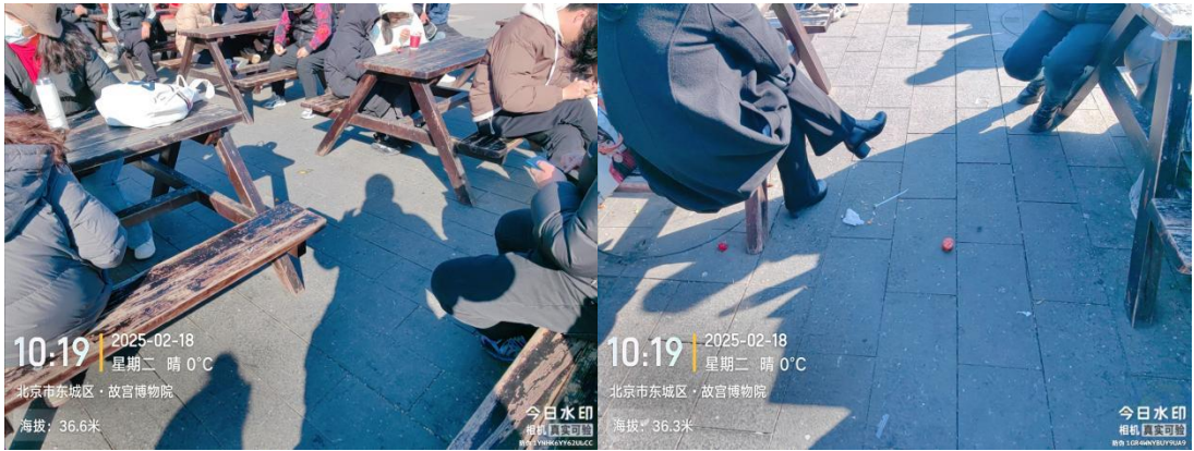
故宫端门广场东侧(地面不洁有废弃物)T10:22