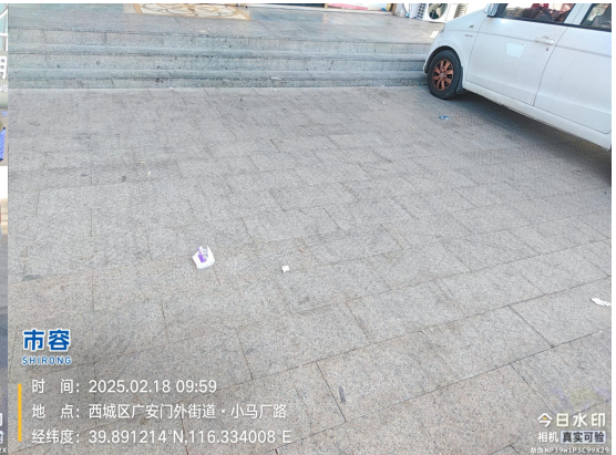
马连道路(东侧茶百道门前)(良好)T10:36