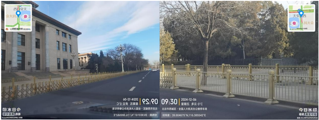
故宫周边道路(良好)T09:33