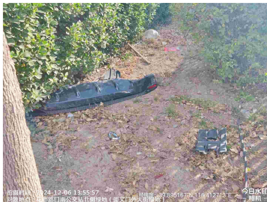
崇文门外大街绿地(花市路口南公交站南侧绿地内有废弃