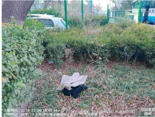
崇文门西大街绿地(崇文门西公交站北侧绿地内有废弃物)T10:34