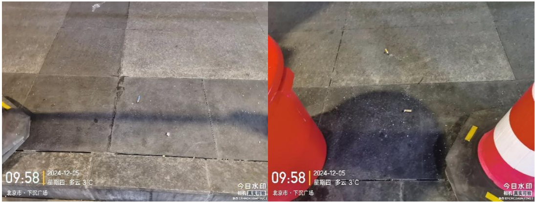
西客站内部道路(良好)T10:00