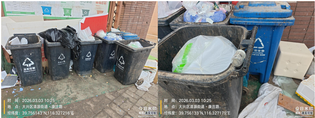
康庄路南侧枣园东里 38 号楼旁垃圾收集站点(周边地面有废弃物及杂物堆放)T10:25