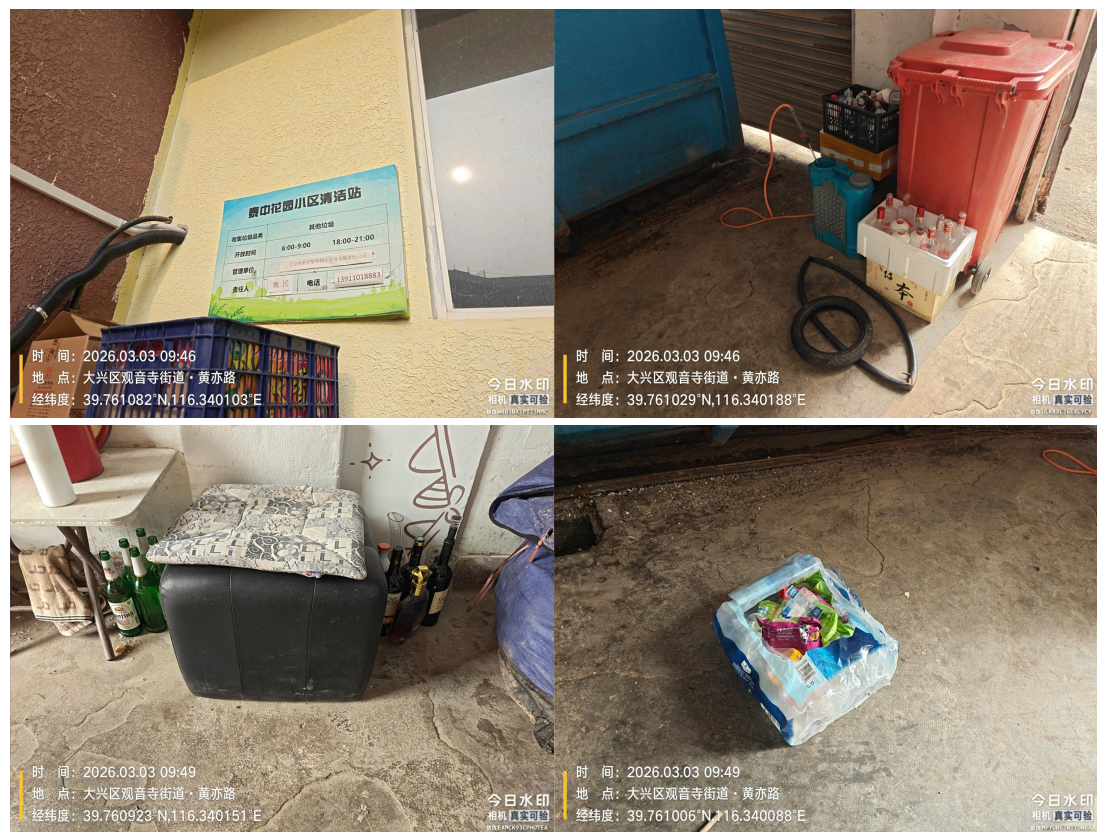
泰中花园小区清洁站(责任区内有杂物堆放) T09:46