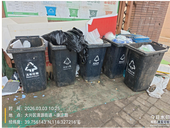
康庄路南侧枣园东里 38 号楼旁垃圾收集站点(垃圾桶破损)T10:25