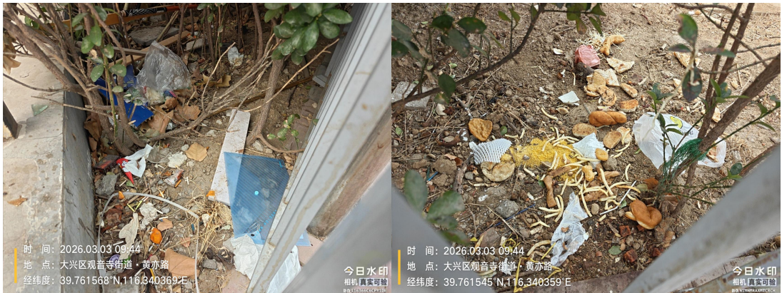
黄亦路(南侧绿地)(绿地内有废弃物)T09:44