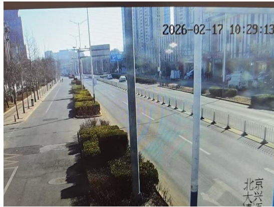
清源北路(边线有浮土)T10:30