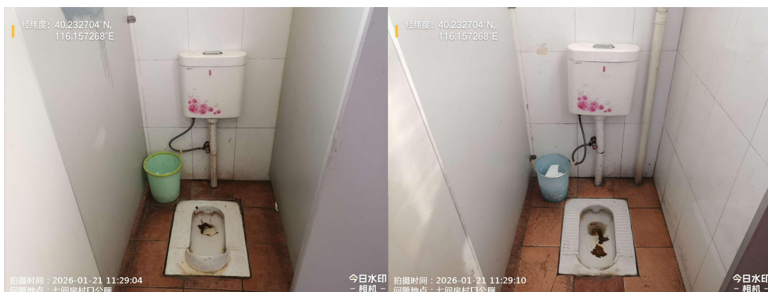
龙虎台村南公厕(良好)T11:29