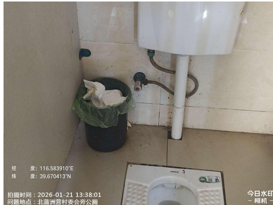
白庙村西公厕(纸篓满冒)T13:57