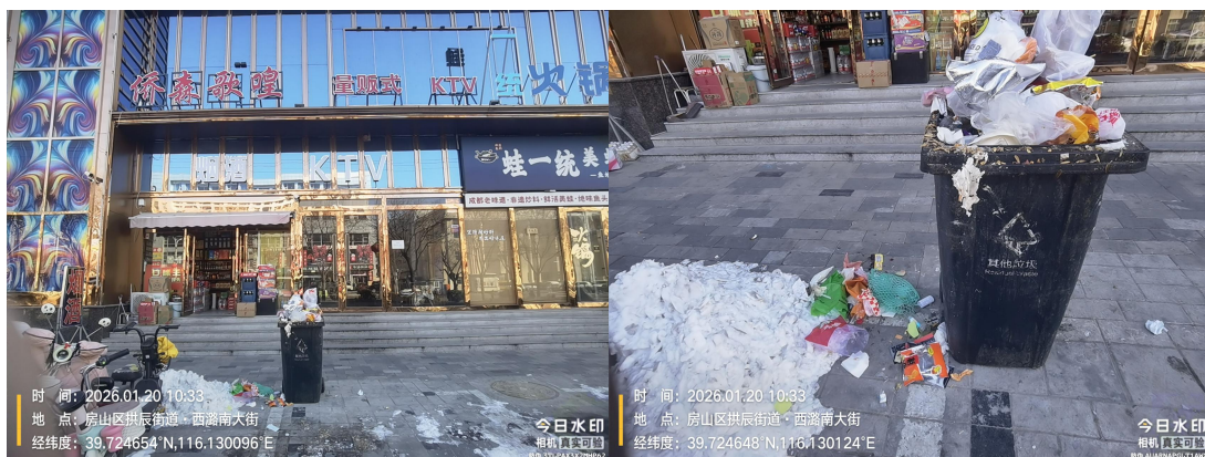
侨森歌隍门前(门前垃圾桶满冒、周边不洁)T10:30