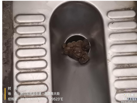
小南关村南公厕(便池内有积存物、小便池地面不洁有尿渍)T10:40