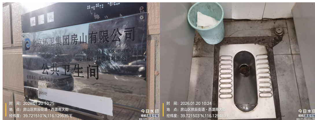
财政局对面公厕(便池内有积存物)T10:24