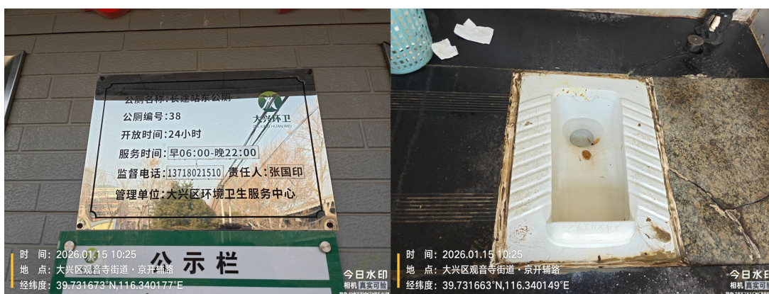
长途站东公厕(纸篓满溢)T10:25