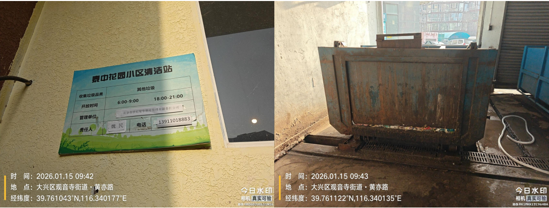
泰中花园小区清洁站(责任区内有污渍)T09:42