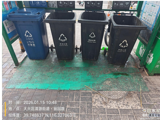
丽园路 30 号院密闭式清洁站(良好)T11:00