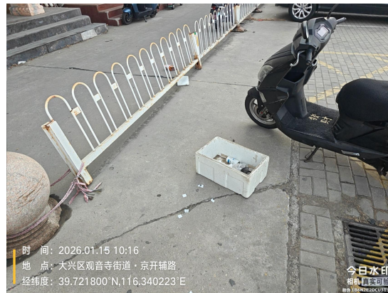
京开辅路(东侧绿地)(绿地内有废弃物及装修垃圾)T08:34