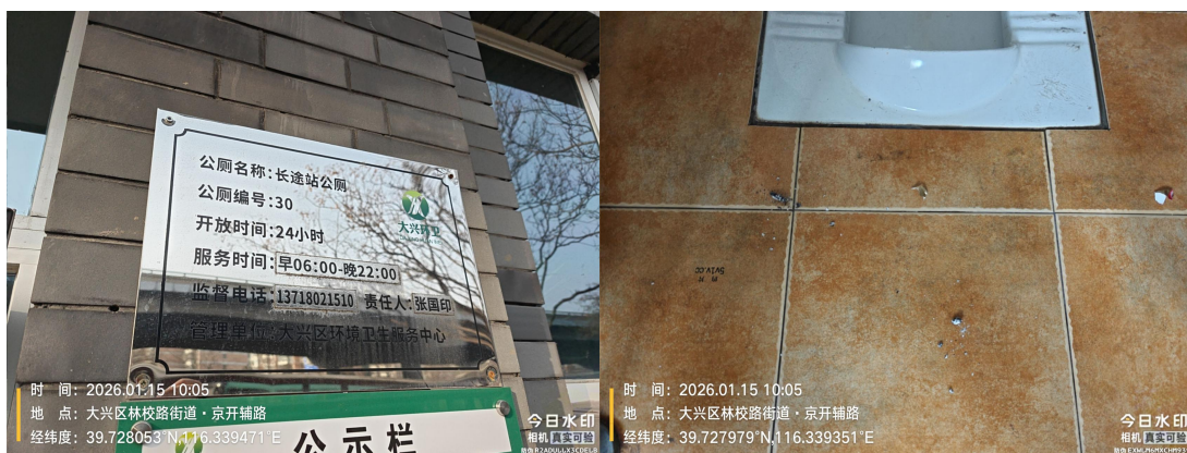
长途站公厕(大便器内不洁)T10:05