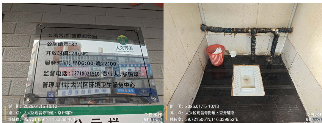
京丽都公厕(厕内墙面不洁)T10:12