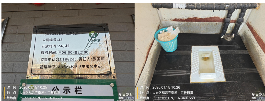
长途站东公厕(保洁员在检查时间段内未在岗)T10:25