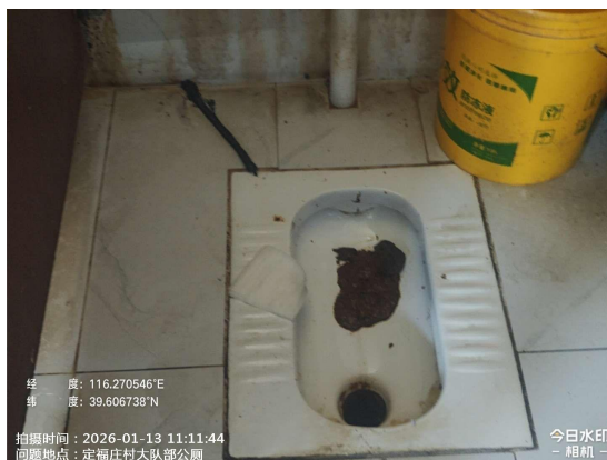
丁村村北公厕(良好)T11:11