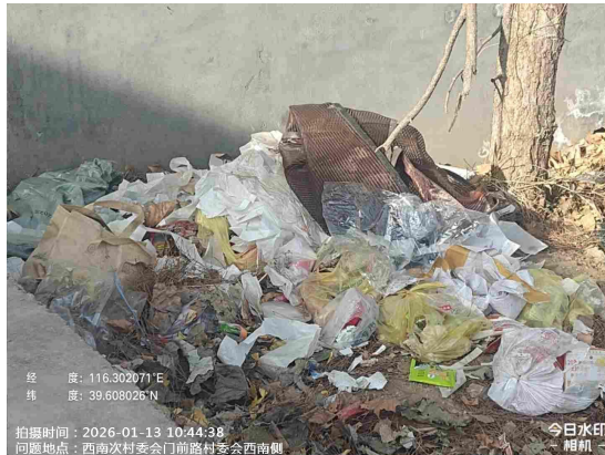
定福庄村村委会门前路(废物箱满冒)T11:17