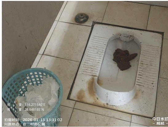
梨园村东公厕(便器不洁)T13:41