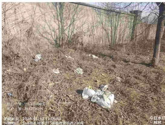
东高各庄村村中心路(路面有废弃物)T12:15