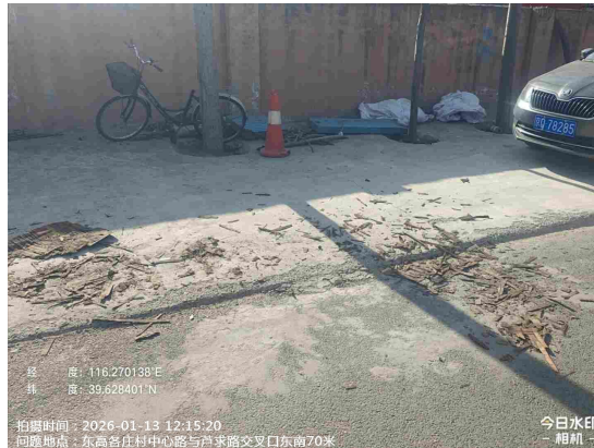
西中堡村村中心路(绿地有废弃物)T09:57