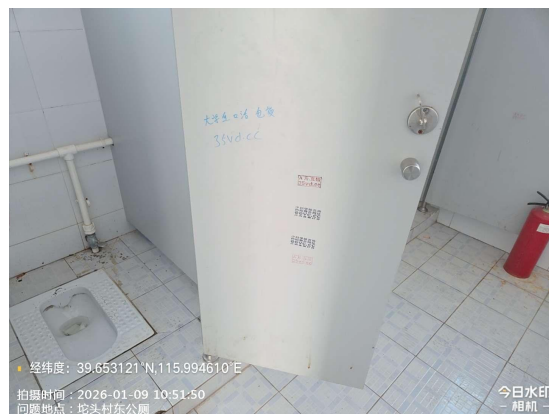
石楼村文化活动现场公厕(厕位不洁)T11:16