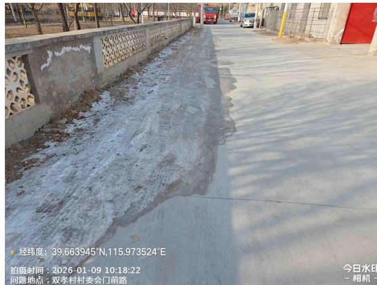
双孝村村内路(路面有积冰)T10:25