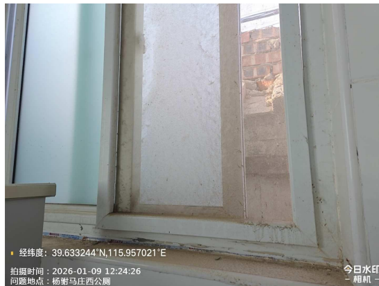
襄驹马庄西公厕(厕门有非法宣传品涂写)T12:48