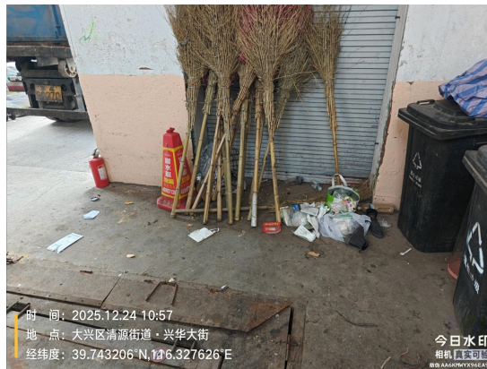
清源西里密闭式清洁站(无运行记录及消毒记录)T10:57