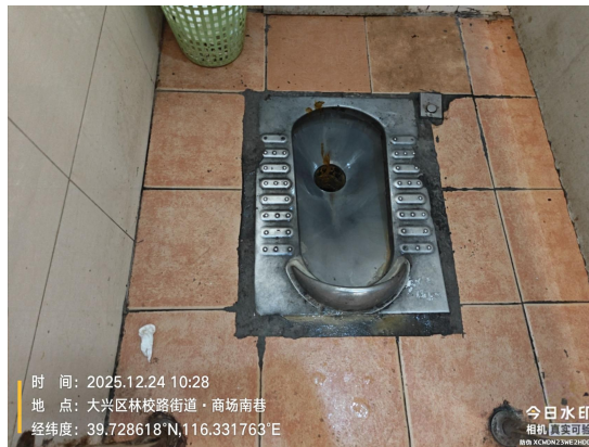
商场南巷公厕(大便器内有积存物)T10:28