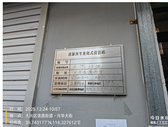
清源西里密闭式清洁站(无拒收单)T10:57