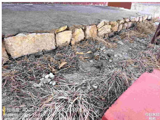
木林镇人民政府门前路(良好)T10:29