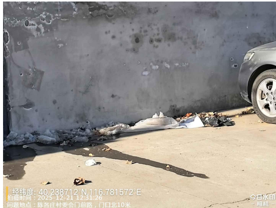
东沿头村村委会门前路(良好)T12:31