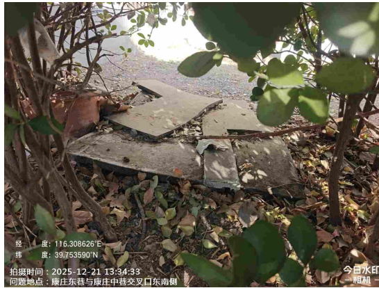
康庄西巷(绿地内有废弃物)T13:20