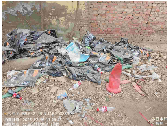
公议庄村中心路(路面有废弃物)T11:20