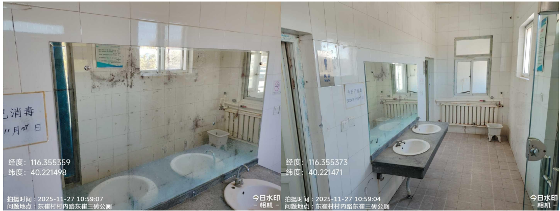
东崔村委会公厕(洗手池台面不洁)T10:49