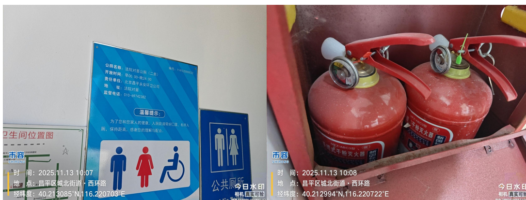
石油大学东北角公厕(蹲台及大便器内不洁)T10:18