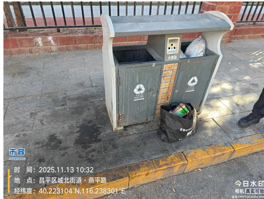
燕平路(果皮箱周边有污渍及废弃物)T10:32