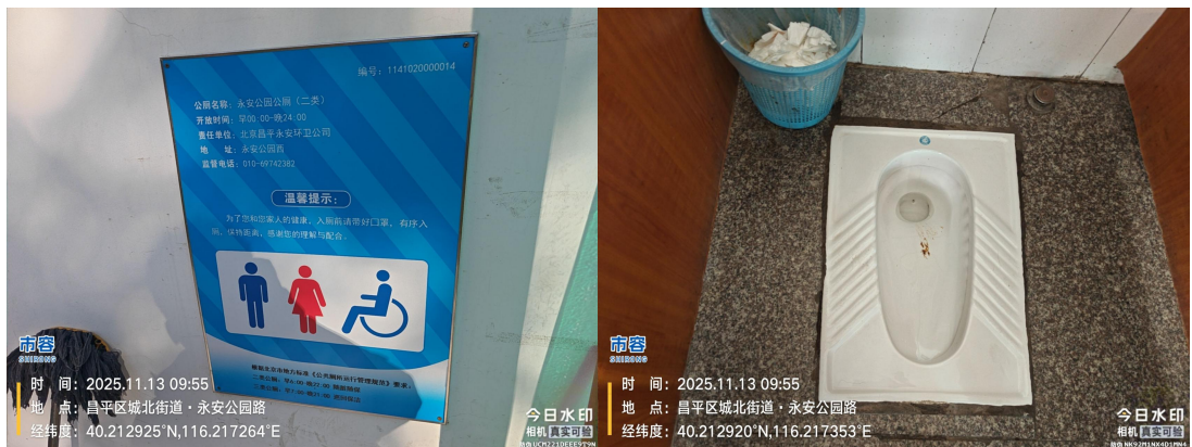
法院对面公厕(灭火器表面有浮土)T10:08