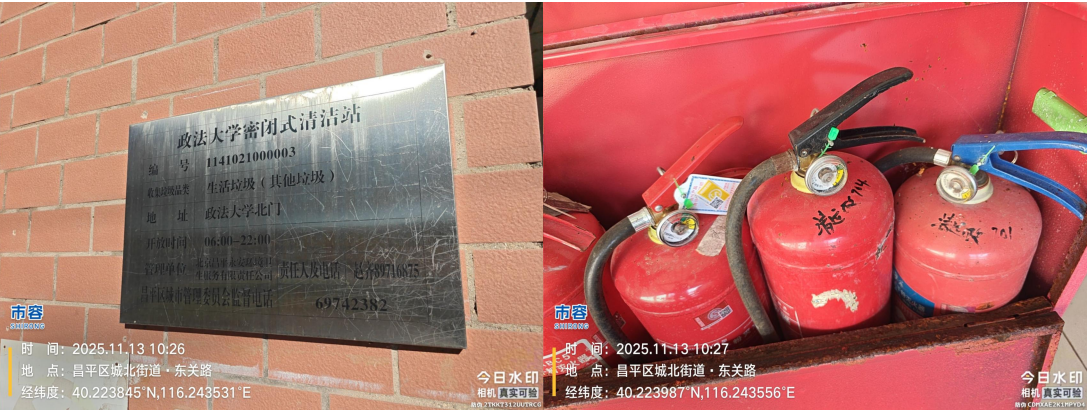
燕平路密闭式清洁站(良好)T10:40