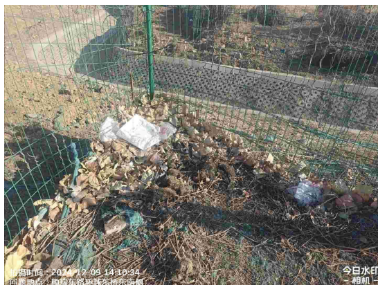
九棵树中路绿地(九棵树中路与文景西街交叉口西北侧绿地内有废弃物)T14:47