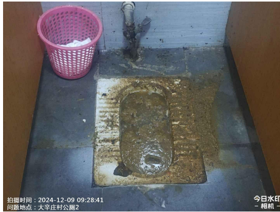
大辛庄村公厕 2(责任区内地面不洁)T09:27