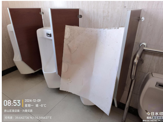
前柳村村东公厕(厕位不洁)T08:53