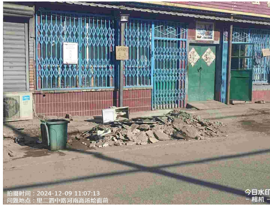
烧酒巷村村委会门前路(良好)T11:02