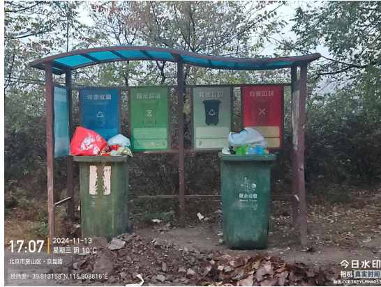
西班各庄村村委会门前路(地面有废弃物)T13:42