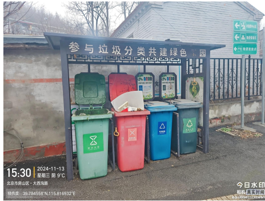
中窖村村委会门前路(地面破损)T15:11