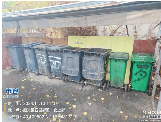
仓上街(南侧元锦江湖菜馆旁垃圾收集站点)(周边地面有废弃物及杂物)T11:07