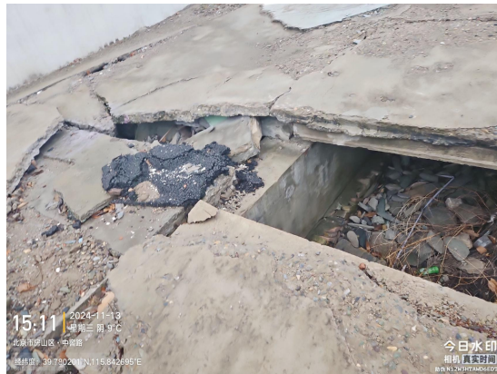
南窖乡政府门前路(良好)T15:37