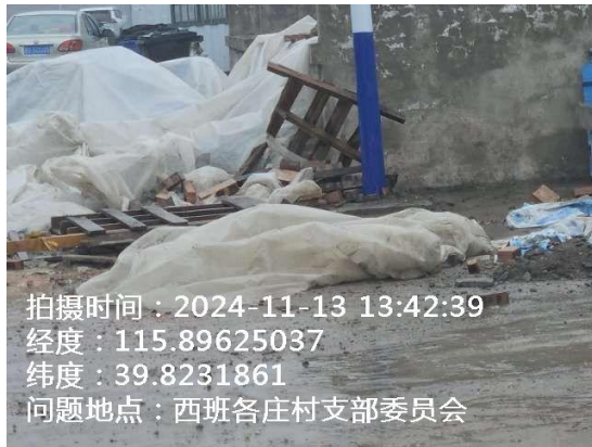
西班各庄村村委会门前路(堆物堆料)T13:42