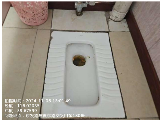
吉羊村村委会楼后公厕(纸篓满冒)T13:32