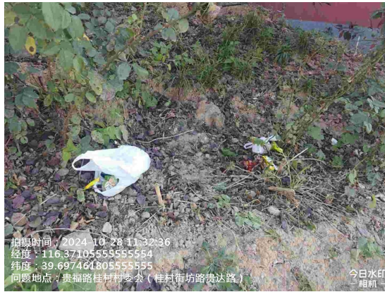
郭上坡村村委会门前路(村委会南侧路与三郭路交叉口西南侧绿地有废弃物)T09:00