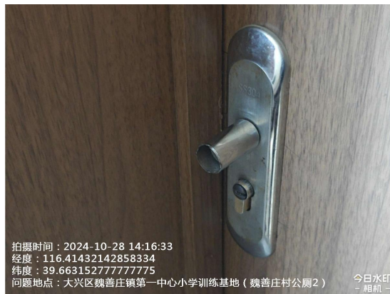
魏善庄镇魏善庄中学对面公厕(铭牌字体不清晰)T13:50