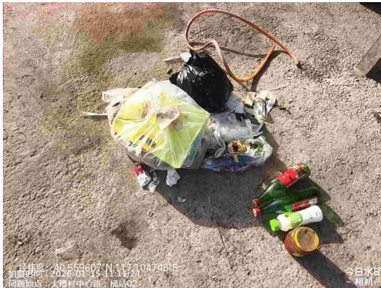
桑园村中心路(路面有废弃物)T11:56