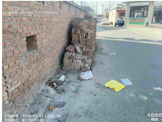
峪口村村委会门前路(绿地有废弃物)T12:35