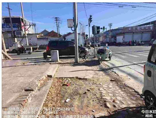
张辛庄村中心路(沟渠内有大量烟头)T10:03