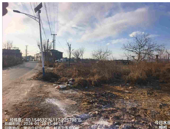
望马台村委会门前路(沟渠内有废弃物)T15:42