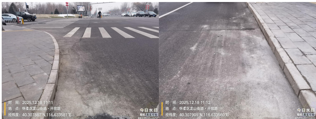
迎宾路(道路边线有浮土)T11:12