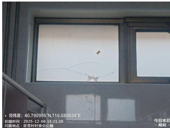
银河沟村公厕 2 (NO.10) (窗户不洁)T14:56