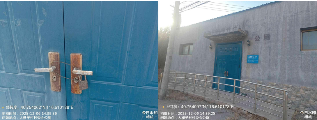
大栅子村公厕 (NO. 11) (公厕未开放)T14:39