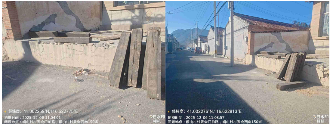
许营村村委会门前路(良好)T11:08