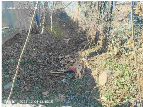
李辛庄村村委会门前路(路面有废弃物)T14:13