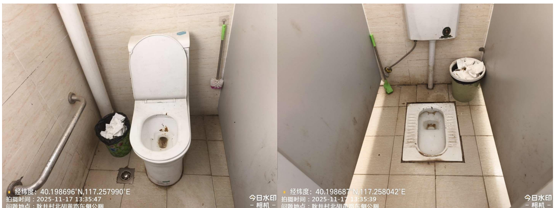
金海湖镇海子村公厕(良好)T13:35