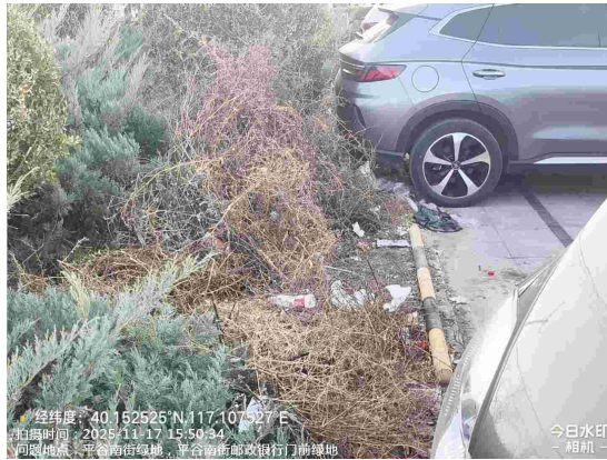
二环路绿地(绿地内有废弃物)T15:36