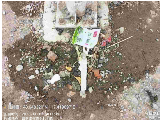
头道沟村中心路(沟渠内有废弃物)T12:46