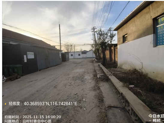
水洼屯村中心路(隔离带有废弃物)T15:27