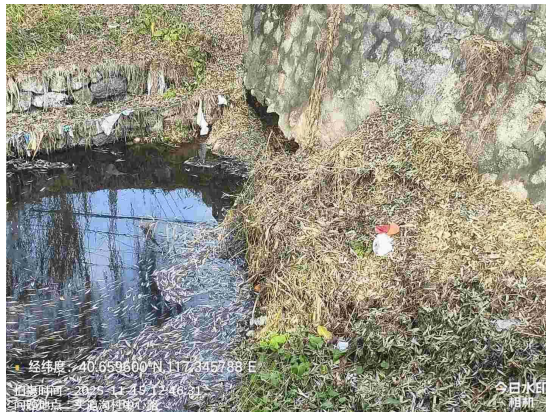
西田各庄镇政府门前路(绿地内有废弃物)T16:43