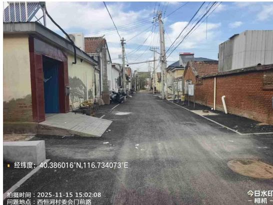
渤海寨村中心路(废物箱周边不洁)T14:31