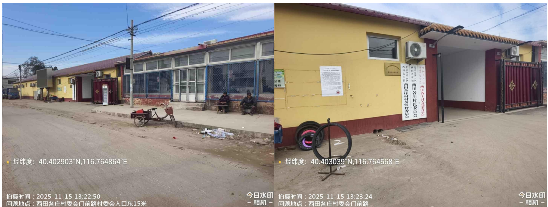
东沟村中心路(良好)T10:22